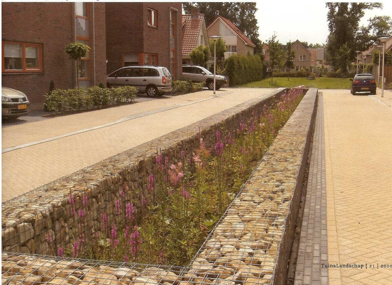
Een moderne, bloemrijke wadi omgeven door schanskorven in de straat Aureliavliet in Enschede.

lige water direct af naar de drain. Voor een goede afvoer van het water is een wadi nodig met 10% van het aangesloten verhard oppervlak. In die verhouding hoort een wadi binnen 24 uur leeg te lopen. Bodem en de grondwaterstand moeten geschikt zijn voor een infiltratievoorziening. De doorlaatbaarheid van de bodem moet worden vastgesteld, net als de gemiddelde hoogste grondwaterstand. Is de laatste te hoog (tussen 150 cm en 50 cm) dan kan je beter een infiltratiebassin aanleggen. Als de wadi goed onderhouden wordt, gaat een dergelijk systeem tussen de 50 en 80 jaar mee.