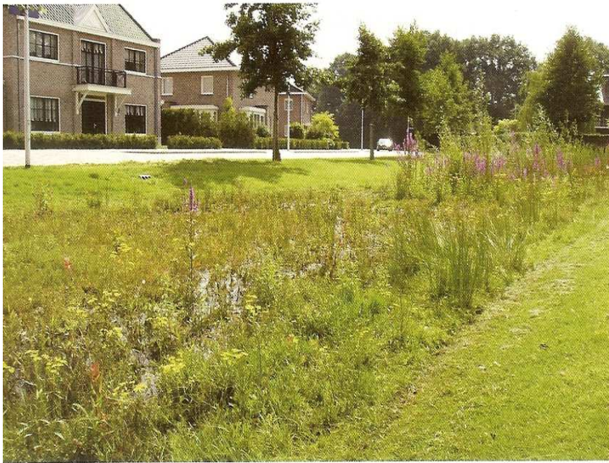
Een nieuwe ontwikkeling is de bloemrijke wadi, zoals hier in de buurt Broek Zuid (wijk Het Broek) in Hengelo.