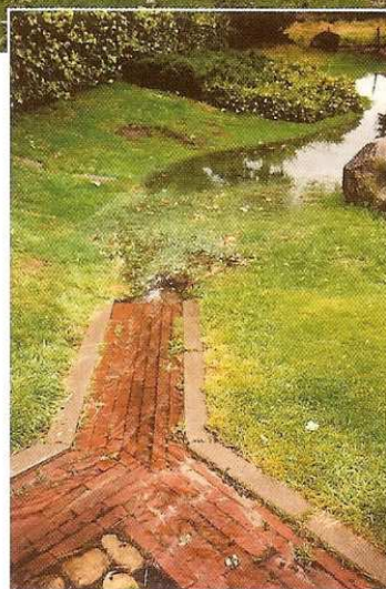
De constructie van de wadi's in de wijk Ruwenbos in Enschede van eind jaren '90 heeft een voorbeeldfunctie. Het regenwater wordt via molsgoten naar het bekken geleid, waarna het afgevoerd wordt naar een nabijgelegen beek.